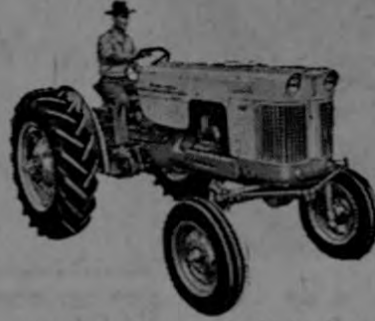
—Modelo 400 para 3 y más discos; transmisión "CASE o MATIC" con un rango infinito de velocidad.