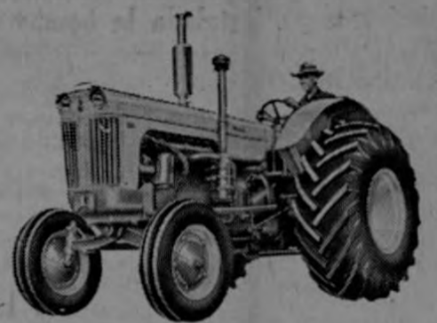
—Modelo 900 para 5-6 discos. Transmisión de 6 velocidades.

Todos estos modelos se pueden ofrecer con cualquier tipo de ruedas y ejes, ya sean ajustables, fijos, de piña, etc.