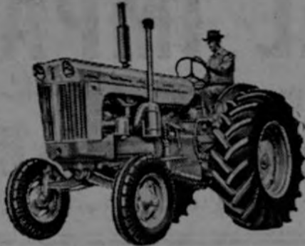
—Modelo 200 para 4-5 discos; con transmisión de 8 velocidades.