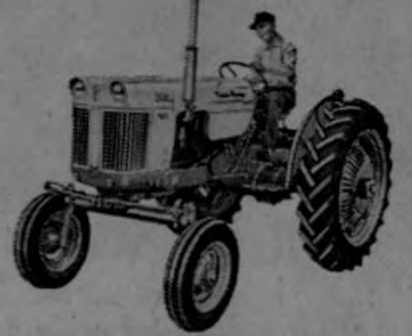
—Modelo 500 para 3-4 discos; con transmisión de 4 velocidades, 12 velocidades o Shuttle.