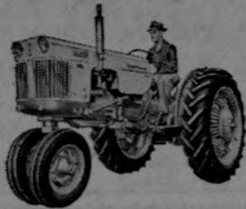
—Modelo 200 para 3 discos: con transmisión de 4 velocidades, 12 velocidades o Shuttle.