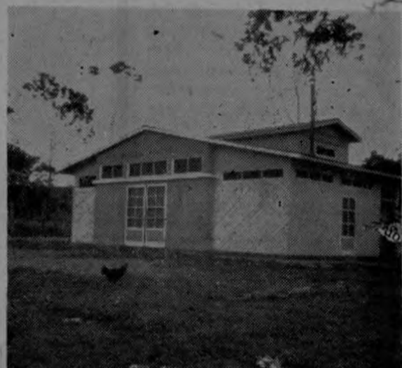
Moderno matadero construido por la Municipalidad con la colaboración del SCISP y el Ministerio de Obras Públicas