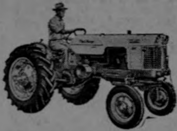
—Modelo 200 para 2 discos con transmisión de 4 velocidades, 12 velocidades, o Shuttle.

CASE. Presenta la línea más fina y completa de tractores agrícolas con 108 modelos a escoger con motor diesel o de gasolina: