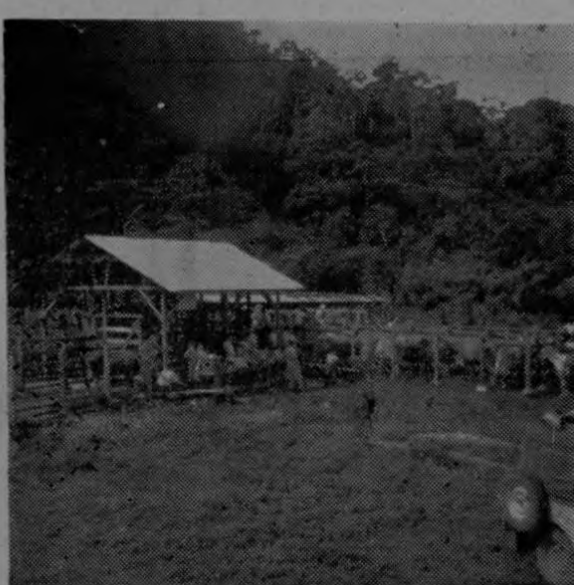
Vista parcial de la nueva plaza de ganado, a donde todos los martes concurren comerciantes y ganaderos a las ferias de pintoresco colorido. Esta plaza fue construida por la actual Municipalidad