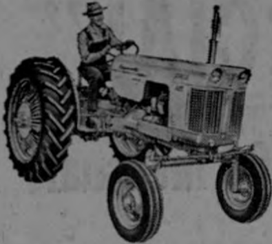
—Modelo 600 para 4 discos. Con transmisión "CASE o MATIC" con un rango infinito de velocidades.