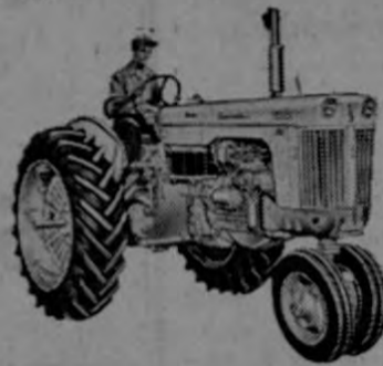
—Modelo 800 para 5 discos, con transmisión "CASE o MATIC" con un rango de velocidades infinito.